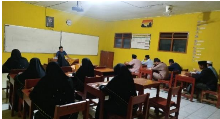
Gambar 1. Santri menyimak pembelajaran bandongan

Bukti dari temuan pertama pada dasarnya cukup menguatkan asumsi bahwa ngaji bandongan tidak hanya berfungsi sebagai metode pembelajaran, tetapi juga sebagai proses sosial yang membentuk perilaku dan makna dalam diri santri. Pola santri yang cenderung mendengarkan dengan tekun, fokus pada penjelasan kiai/ustaz, serta menerima pemahaman secara bertahap menunjukkan adanya internalisasi nilai kesabaran belajar dan penghormatan terhadap otoritas keilmuan. Hal ini sejalan dengan fakta bahwa pemahaman tidak hanya dibangun di kelas, tetapi juga diperkuat melalui pengulangan, catatan, dan diskusi di luar pembelajaran formal. Dalam (Humam & Hanif, 2025) menyatakan bahwa Peserta didik yang mana disini (Santri) diharapkan untuk tetap aktif, dan mereka tidak diperbolehkan menjadi pasif dengan hanya mendengarkan ceramah yang disampaikan oleh guru atau ustadz.