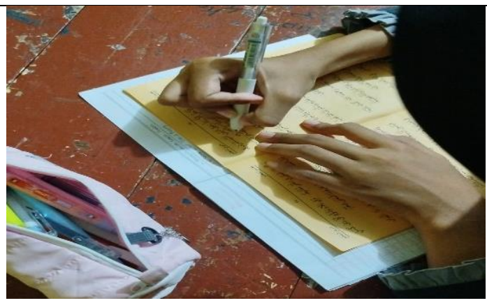
Gambar 3. Kitab Pembelajaran (Kitab Ta'limul Muta'allim Fi al-Thariqi Ta'allum)

Temuan kedua menunjukkan bahwa praktik ngaji bandongan tidak hanya berkaitan dengan teknik belajar, tetapi juga memperlihatkan relasi kuasa, dukungan sosial, dan internalisasi norma keagamaan dalam pembelajaran. Otoritas ustaz tampak melalui posisi guru sebagai sumber utama pengetahuan, sementara dukungan sosial terlihat dari kebiasaan santri saling membantu memahami materi di luar kelas. Selain itu, praktik bandongan juga membentuk nilai kesabaran, ketekunan, dan penghormatan terhadap guru dan ilmu. Meskipun telah beradaptasi dengan sistem kelas modern, tradisi belajar pesantren tetap dipertahankan dalam kehidupan sehari-hari santri.